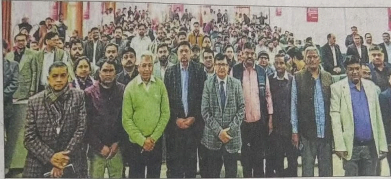
भाषा विवि में मंगलवार को लगे जॉब फेयर में चयन के बाद अभ्यर्थियों और शिक्षकों ने खुशियां मनाईं।